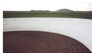
Lisier sans Vitaliseur, forte croûte flottante