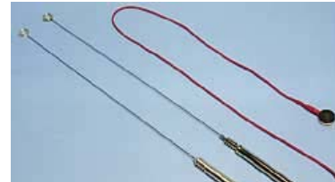
Tenseur Weber-Isis I en laiton doré Tenseur Weber-Isis II plaqué or, avec câble et sonde

Tenseur Weber-Isis II Avec son câble et sa sonde, le Tenseur II offre davantage de possibilités d'utilisation.