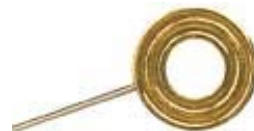
Anneau du Tenseur I et II Dimensions 2.2 cm x 2 mm. L'anneau du Tenseur est polarisé : côté cannelé pour les hommes, côté lisse pour les femmes, à positionner face à l'élément à tester / traiter.