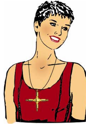
Port correct de l'Amulette Isis

La Croix Isis ne remplace pas le Beamer Weber-Isis et ne possède pas ses propriétés d'harmonisation spécifiques.