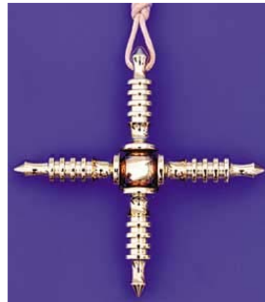
Amulette Isis en laiton plaqué or 7.23 cm x 7.23 cm / 42 grammes

Les effets de l'Amulette Isis ne peuvent bien sûr pas être mesurés dans les laboratoires de la science dominante actuelle par les appareils de mesure habituels. Cependant, toute personne portant l'Amulette Croix Isis en confiance se verra gratifiée de ses bienfaits." Eckhard Weber