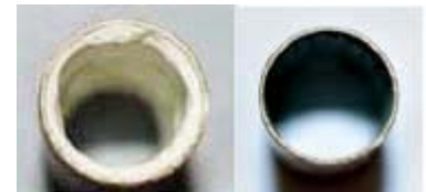
Dépôts calcaires dans une conduite d'eau avant la pose de l'activateur d'eau, puis quelques semaines après